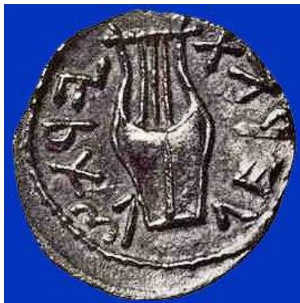
Silver coin (shekel) with Kinnor of David . A Simon Bar Kochba's coin For the Freedom of Jerusalem , ca. 132-135 C.E.

En uiteraard zijn er veel meer voorbeelden van te zien. Het gaat hierbij op dit moment dus om de specifieke verschillen tussen harp en lier. Vanuit de oudste Joodse samenleving, dus van de periode waarin de Psalmen tot stand kwamen, zijn er geen afbeeldingen beschikbaar; wel zijn er later afbeeldingen op munten, zoals de onderstaande munt uit de zg. Bar-Kochba-periode, waarop een lier voorkomt. De afbeelding was een eerbetoon aan David; het wordt 'de Davidsharp' genoemd, maar is qua vorm in feite een lier – een taalgebruik dat kennelijk ook doorwerkt in de vertaling van de betreffende Hebreeuwse woorden..